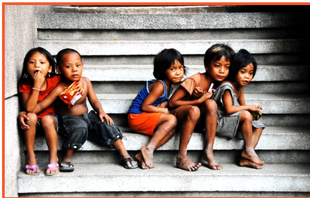
De nombreux enfants des rues dans les villes sont des proies faciles de l'industrie du sexe et la traite des êtres humains.

Sous la pression de notre partenaire et de certaines associations actives dans le domaine, telles que l'UNICEF et l'ECPAT, la loi a finalement été modifiée en septembre 1997, rendant le viol des gar-